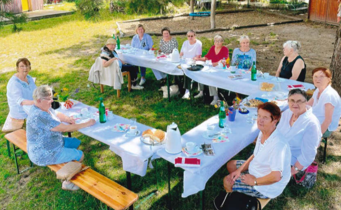
Beim Sommerfest im Kitagarten