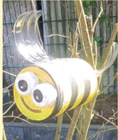
Bezugsfertig: ein Hotel für Bienen

Wohl nicht zu kurz. Die Goldtaler (Jägerschnitzel) waren bei den Kindern der Renner.